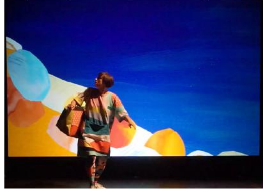
cue 4 / 19e minuut loopt bergafwaards, komt langs blauwe steen