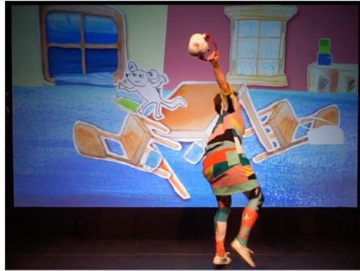
cue 2 / 5e minuut meubels gaan drijven in het water